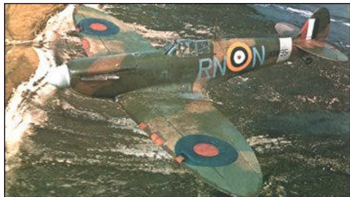
Un Spitfire II du 7 Squadron survole les côtes anglaises en 1941.

Le Spitfire a été le seul chasseur allié à sortir en continu des chaînes de production pendant toute la durée de la Seconde Guerre Mondiale et même au-delà, puisque le dernier est sorti en 1947, onze ans après le premier vol du prototype : le Mk XXIV. Les derniers Spitfire de la RAF (des Mk XIX de surveillance météo) ont été retirés du service en 1957, mais des Mk IX biplaces d'entraînement servaient encore en 1968 au sein de l'armée de l'air irlandaise. Ils ont été utilisés dans le film "Le jour le plus long".